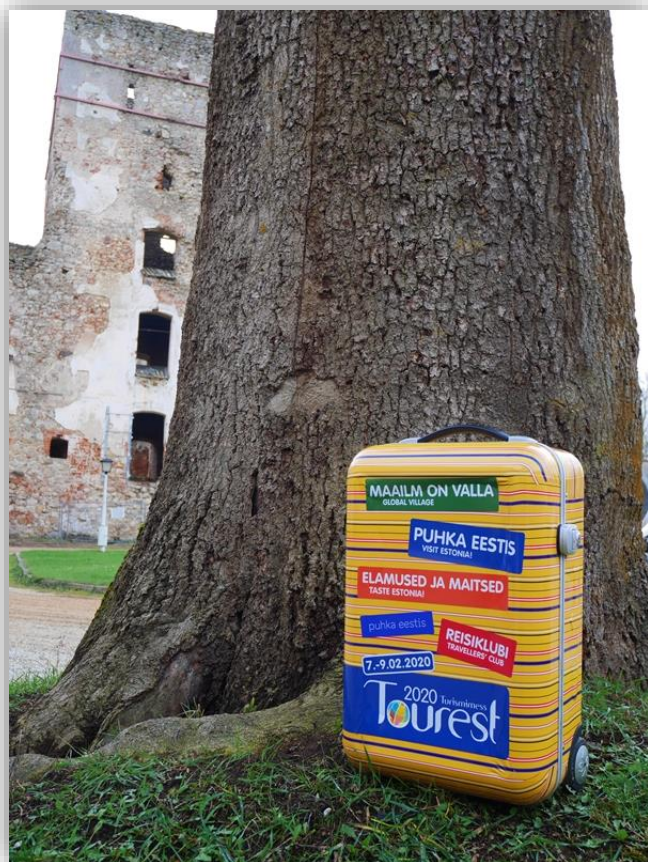
Põltsamaa FAM-tuur 6.november 2019