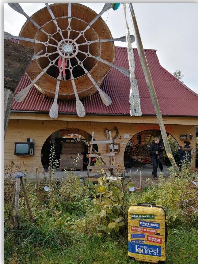
Hiiumaa FAM-tuur 10.-11. oktoober 2019